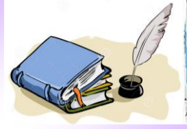
Langue et Littérature